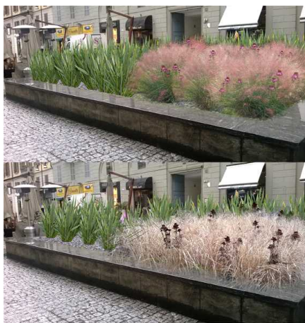
Adotta il Verde Pubblico Aiuola 3, Corso Como

Il nuovo programma GREEN ISLAND 2014, ideato da Claudia Zanfi (direzione Atelier del Paesaggio) con un progetto speciale per il verde urbano, parte dal quartiere Isola nella settimana dall' 8 al 13 Aprile, in contemporanea con Milano Design Week