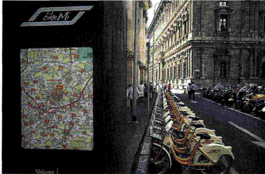
La fermata Una stazione BikeMi nel centro storico. In totale sono 3.400 le bici disponibili

Le stazioni attivate da Comune, Atm e gestore ClearChannel dal centro storico alla cerchia 90/91